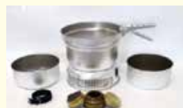
▲ 事故が発生した同等品(アルコールバーナー)

そんな中、キャンプ用品のアルコールバーナーによる事故が発生し、利用者がケガを負いました。