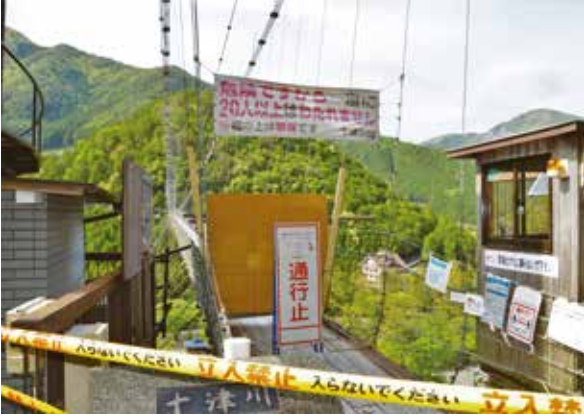
▲通行止め実施中の「谷瀬の吊り橋」(大字上野地)

村では、感染拡大を抑えるため、村内すべての公衆浴場など公共施設を臨時休館としました。また、4月25日からは、東京都、京都府、大阪府、兵庫県に緊急事態宣言が出されたことを受けて、引き続き公共施設を休館にしたほか、大型連休中は人気の観光スポットである「谷瀬の吊り橋」の全面通行止めを実施しました。